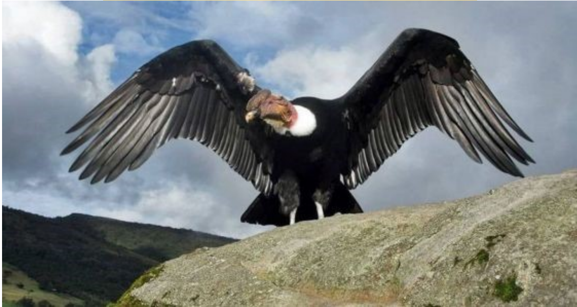
La lenta agonía del cóndor, el dios alado de Sudamérica