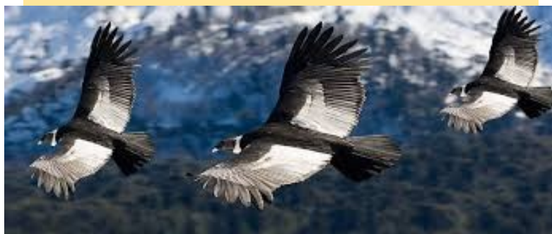
Orinoco Padre Rio: El cóndor de Los Andes