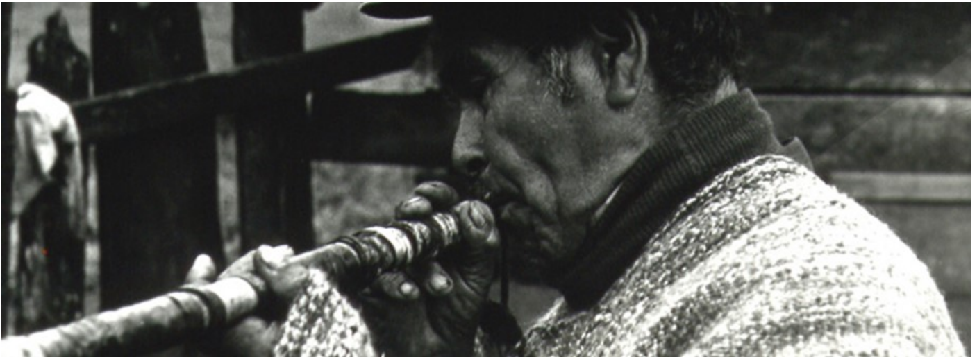
Mapuche – Música y danza - Chile Precolombino

De hecho los grandes músicos Mapuches se levantan con el sol y se acuestan con el sol, sus instrumentos los fabrican ellos mismos desde la naturaleza, utilizan árboles, enredaderas, de las cañas, del bambú, de la piedra también, los músicos sacan sus instrumentos de todo esto, y así hacen música que tiene que ver con la espiritualidad, principalmente para la sanación, para las cosechas, para el nacimiento de los hijos, para mecer las guaguas o criar la guagua, incluso las mujeres cantan cuando están tejiendo en el telar, están tejiendo y están cantando.