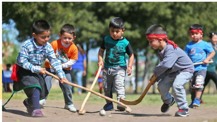
Foto: Gabriel Gatica R. Niños aprenden cultura mapuche jugando palín – ArtePopular

En este momento interviene Javier y nos cuenta: “este es un woño (y lo enseña), en español es conocido como una chueca, es un instrumento que se usa para hacer música, así como también es usado para medir de alguna forma la fuerza entre un integrante de una comunidad y otro integrante de otra comunidad.”