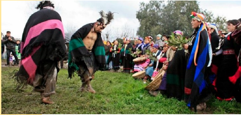
Nguillatún: La importante ceremonia espiritual del pueblo mapuche

Nosotros le cantamos a la vida, al vivir nuestro, a nuestra historia, a nuestras necesidades, ya sean positivas o negativas, porque para muchos pueden ser negativas algunas necesidades, es decir, lo que es bueno para algunos es malo para otros y depende del hábitat, de la concepción del mundo que vivas, de su cosmovisión; porque cuando hablamos del mundo en política, en español decimos que “el progreso y el desarrollo son importantes”. Los pueblos indígenas no hablamos de desarrollo y progreso porque decir, “vamos a impulsar el progreso con plata, cortando unos cuantos árboles o quitando unos cerros para pasar por allí”, eso implica que se estaría destruyendo la naturaleza por ese progreso y los pueblos originarios no pensamos así, nosotros llamamos progreso y desarrollo a cuando estamos bien, cuando tenemos salud, cuando estamos en armonía, es ahí cuando encontramos el equilibrio.