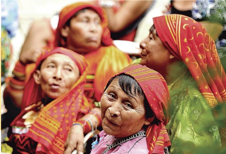
La herencia panameña que reside en la cultura indígena

A los jóvenes se les tiene que concientizar, porque cuando llegan a la ciudad ya no quieren hablar el idioma, yo no sé si es que tienen pena, pero deben concientizar a los jóvenes. La mamá debe hablar con el niño en la casa, porque la cultura de nosotros se está perdiendo aquí en Panamá. Yo digo que también les da pena porque en la calle cuando van se burlan de ellos, anteriormente se burlaban de nosotras las señoras que estábamos vestidas de “mola” y ahora no, ya eso es normal.