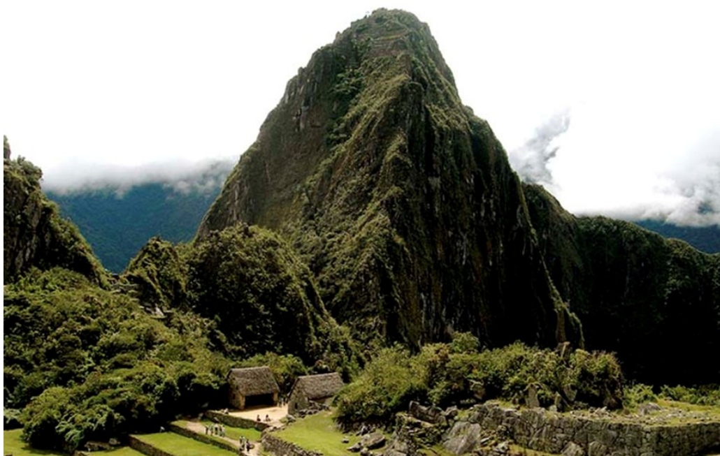
Apus: los espíritus de las montañas incas