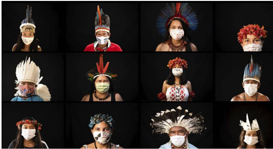
Cultura Tradicional y Pueblos Indígenas – EVE Museos e Innovación (evemuseografia.com)