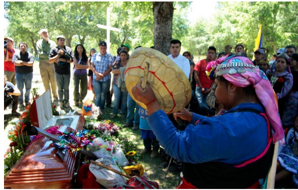
Así es cómo el pueblo mapuche despedía a sus difuntos