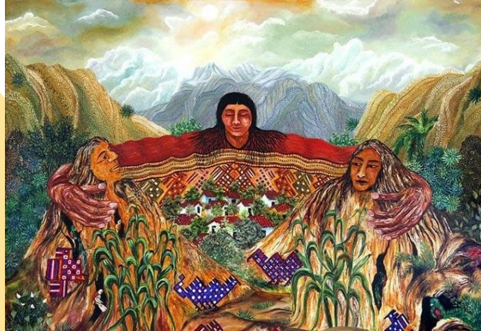
Pachamama: Origen, qué es, historia y mucho más (hablemosdeculturas.com)

La doctrina del descubrimiento se ha discutido bastante y cuando en algún momento yo participé en una reunión de éstas, dije que más importante para nosotros era crear una doctrina de conexión porque los pueblos indígenas a partir de los procesos de colonización hemos perdido mucho la conexión con nuestro entorno, con aquello que tenían nuestros abuelos. Eso ha sido un proceso que ellos han logrado a través de miles y miles de años, muchos de nosotros hemos perdido eso y tenemos que recuperarlo, debemos estar muy enfocados en ese proceso de la conexión, de volver a ver todo lo que está a nuestro alrededor y volver a conectar con la Pachamama, el agua, el aire, con los beneficios que trae para nosotros, para nuestra salud, para nuestro equilibrio social comunitario.