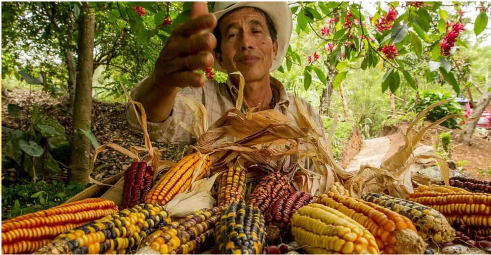
Guardianes de semillas resisten al monopolio de empresas multinacionales - Cxhab Wala Kiwe (nasaacin.org)